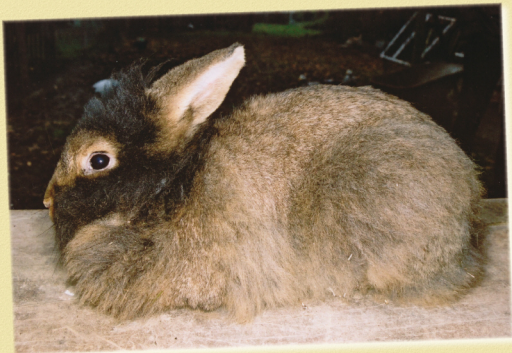
De oren zijn vrij kort