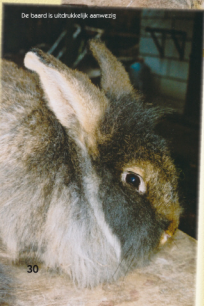
De baard is uitdrukkelijk aanwezig