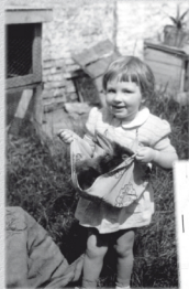
Dochter Verwulgen met een baardkonijn in haar schoot. De foto dateert van begin jaren '60.

opwaaien. Tijd om de fokker die indertijd deze dieren showde bij het verhaal te betrekken.