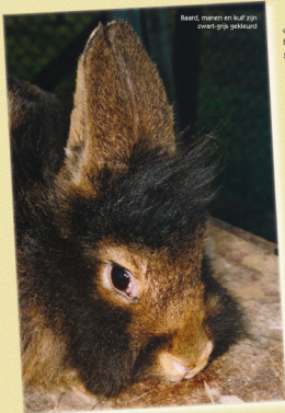
Baard, manen en kulf zijn zwart-grijs gekleurd

de aanwezigheid van de roof-factor in de pels, in sommige gevallen neigt de pelskleur zeer sterk naar de haaskleur. Door kruising met gele Bourgondiërs ontstonden er gele baardkonijnen. De zwarte baardkonijnen waren het gevolg van een kruising met zwarte Alaska's.