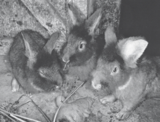
Rammen, 10 maanden oud