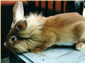
Dit konijn onderscheidt zich van de Gentse baarden o.a. door een andere consistentie van de lange beharing, het ontbreken van de lange beharing op de flanken en het lage lichaamsgewicht

In tegenstelling tot angorakonijnen vraagt de vacht van het baardkonijn weinig aandacht en klit de vacht zeer zelden samen. Om deze reden kunnen baardkonijnen ook op stro (of op houtkruken) geplaatst worden. Omdat ze relatief groot zijn, breng je de baardkonijnen best in grote hokken of nog liever in grote rennen onder. Hoewel dit vaak wordt gesuggereerd, zijn de dieren door de uitzonderlijke beharing niet vatbaarder voor ziekten (vachtaandoeningen, ademhalingsproblemen, oogproblemen,...) dan andere normaal behaarde rassen.