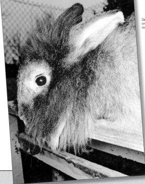
De goed, maar niet extreem ontwikkelde baard van een oeverjaerse voederder