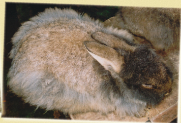
Voedster met lange beharing op de flanken en dijen. Op de rug en de oren is de beharing normaal