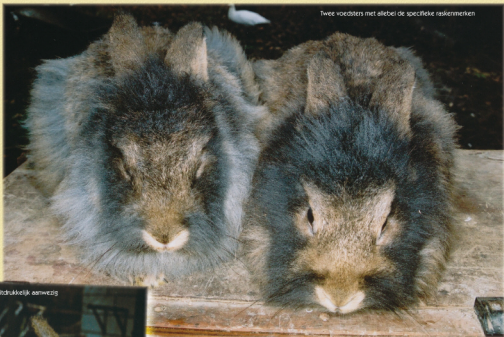
Twee voedsters met allebei de specifieke raskenmerken

Het Gentse Baardkonijn is een markant en zeldzaam ras dat in België op het punt van uitsterven staat. 'Red het baardkonijn' was de oorspronkelijke en dramatische titel boven dit artikel, maar door vrij recente exporten naar Duitsland schijnt er een klein lichtje in de duisternis te branden en lijkt het ras voorlopig van uitsterven behoed. Sta ons toe om u mee te slepen in het verhaal van een bijzonder ras dat om aandacht smeekt!