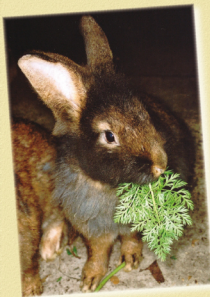
Bij deze jonge ram is de baard minder ontwikkeld dan bij de oudere voedsters

baardtype en beharing, maar door de nauwe inteelt was de vitaliteit van deze stam wel erg verzwakt. De selectie gebeurde aan de hand van de summier gegevens en foto's die eerder gepubliceerd werden. Om de inteeltproblemen op te lossen, werden rasloze voedsters met gelijkend type en bouw in de stam gebracht. In 1990 schreef De Clercq zijn